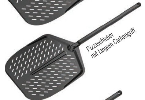
Pizzaschieber mit langem Carbongriff