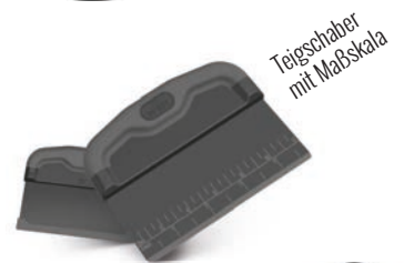
Teigschaber mit Maßkala