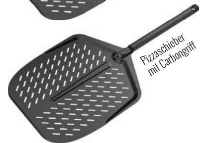
Pizzaschieber mit Carbongriff