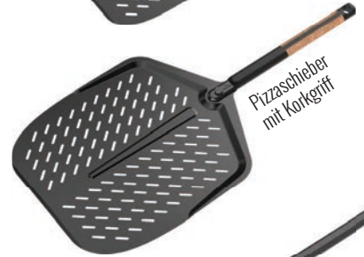
Pizzaschieber mit Korkgriff