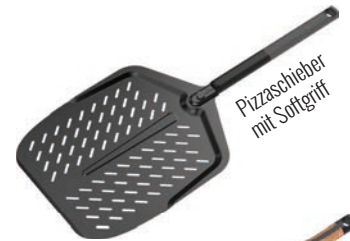
Pizzaschieber mit Softgriff

Erlebe das elegante und stilvolle Design unserer neuesten Pizzaschieber, Messer und Schneider aus schwarzem Aluminium. Wir haben unseren beliebten TPE-Pizzaschieber mit weichem Softgriff ausgestattet und ergänzen das Griffsortiment mit drei neuen, fantastischen Optionen: Kork, Carbon und einen verlängerten Carbonegriff.