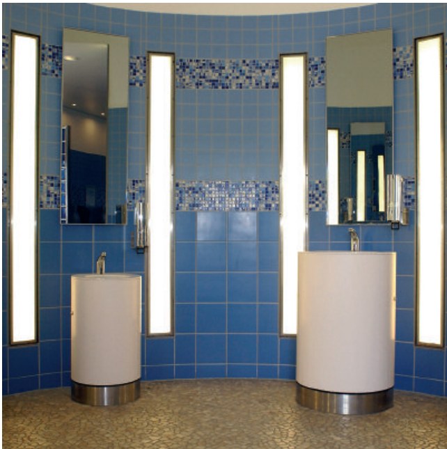
Variables Leistungsspektrum – für alle Fugenbreiten und alle keramischen Beläge.

4 Nach dem Abtrocknen den verbleibenden Mörtelschleier mit einem leicht feuchten Schwamm entfernen.