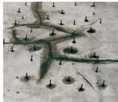
Risse vergießen und hohl liegenden Estrich verpressen mit PCI Apogel F.